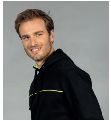
Piping giallo fluo anteriore e posteriore