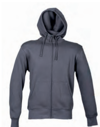
DARK GREY 993312