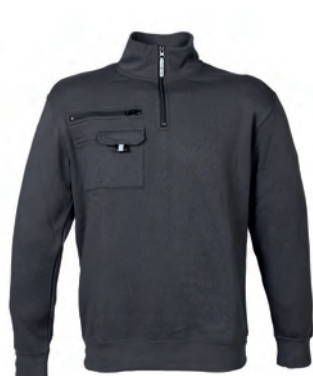
DARK GREY 989191