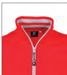
Collo a lupetto con righe in contrasto