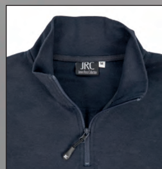
Collo a lupetto con nastro di rinforzo, zip corta nastrata