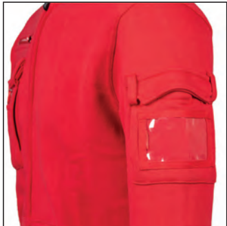
Tasca con velcro sul braccio e portabadge