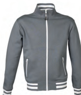
GREY 993993 details WHITE