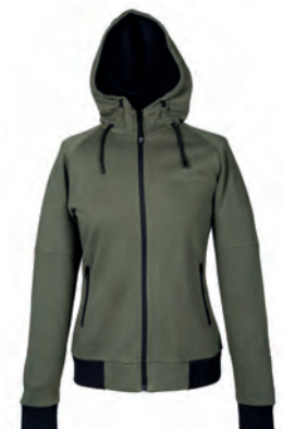
ARMY GREEN 993204