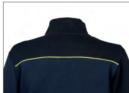
Piping giallo fluo sulla schiena