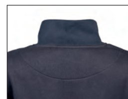
Mezzaluna di rinforzo dietro il collo