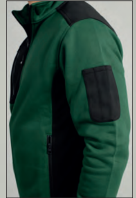
Triplo portapenna sul braccio