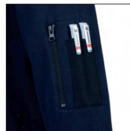
Una tasca sul braccio con zip e doppio portapenne