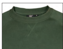
Cucitura incrociata sotto il collo