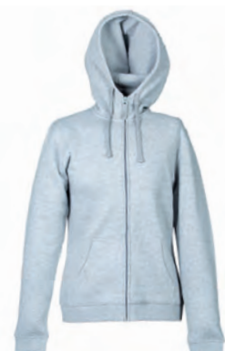
GREY MELANGE 993323