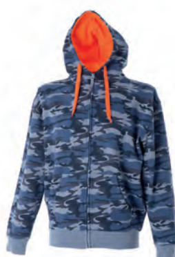
CAMOUFLAGE BLUE 989348 details ORANGE FLUO