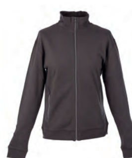
DARK GREY 992872