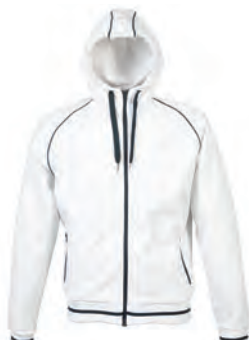
WHITE 988601 details NAVY