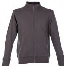
DARK GREY 992862