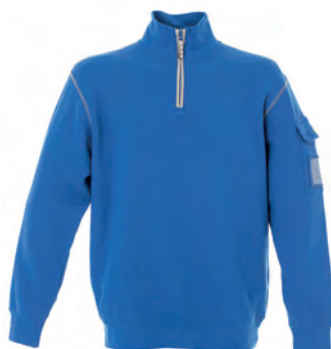
ROYAL 987107 details MELANGE