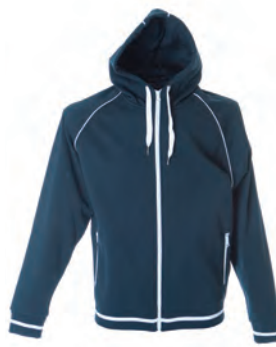
NAVY 988600 details WHITE