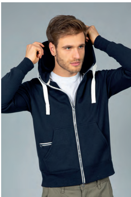
Cappuccio foderato in jersey, tasche a marsupio, taschino con zip