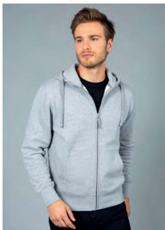
Zip lunga coperta