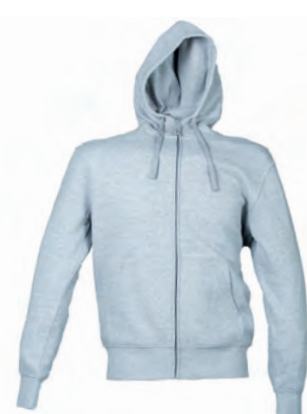
GREY MELANGE 993313