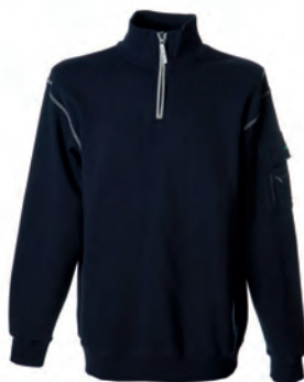
NAVY 987102 details MELANGE