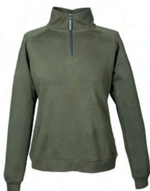
ARMY GREEN 993181