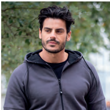
Cappuccio foderato in jersey