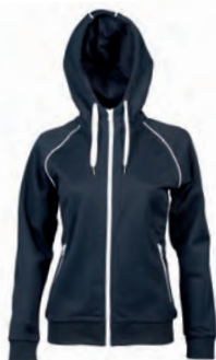
NAVY 989370 details WHITE