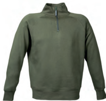
ARMY GREEN 993161