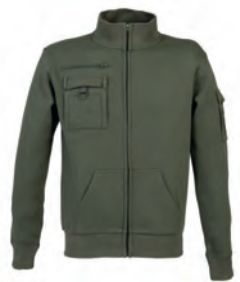
ARMY GREEN 993976