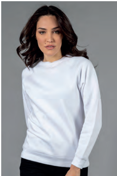
Polsini e fondo maglia in costina elasticizzata