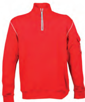
RED 987103 details MELANGE