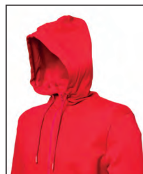
Cappuccio con cordini e stopper in pvc in tinta