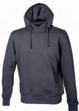
DARK GREY 993332