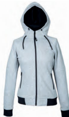
GREY MELANGE 993203