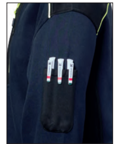
Triplo portapenna sul braccio