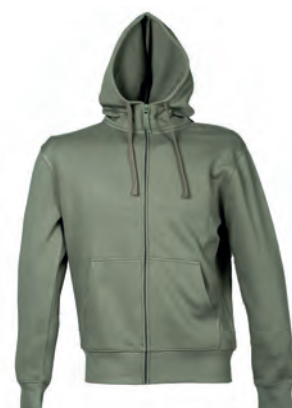
ARMY GREEN 993316