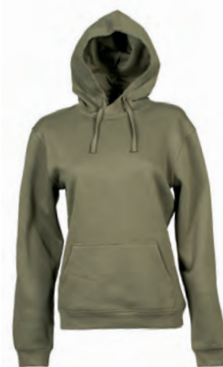
ARMY GREEN 994160