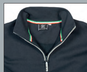
Nastro di rinforzo tricolore nel collo