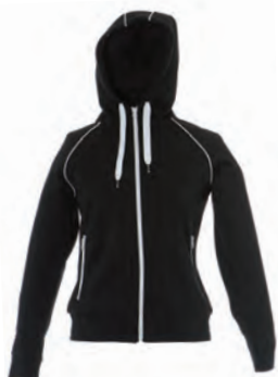
BLACK 989373 details WHITE