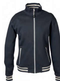
NAVY 994000 details GREY