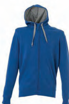
ROYAL 989344 details MELANGE