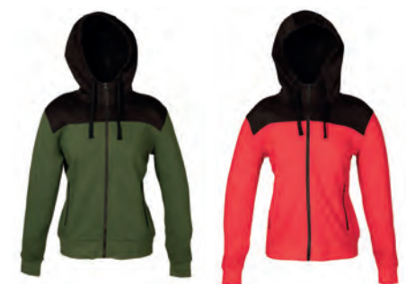
ARMY GREEN 994382