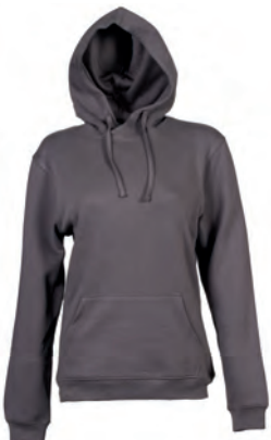
DARK GREY 994162