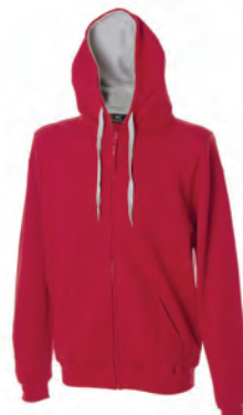
RED 988233-C details GREY