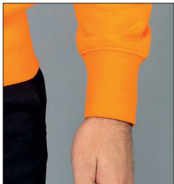
Polsini in costina elasticizzata