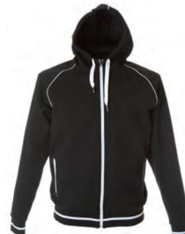
BLACK 988602 details WHITE