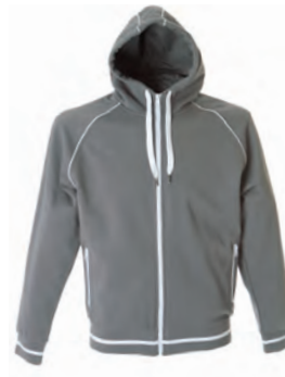
GREY 988603 details WHITE