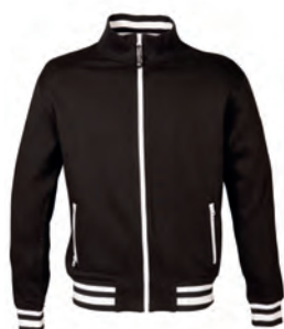
BLACK 993991 details WHITE