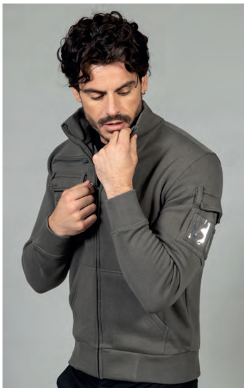
Una tasca sul braccio con portabadge