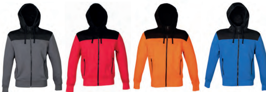
DARK GREY 994371