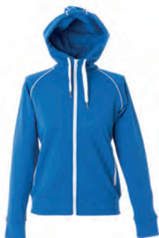
ROYAL 989372 details WHITE