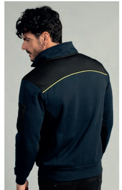
Piping giallo fluo sulla schiena