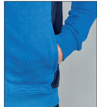
Due tasche con zip coperte