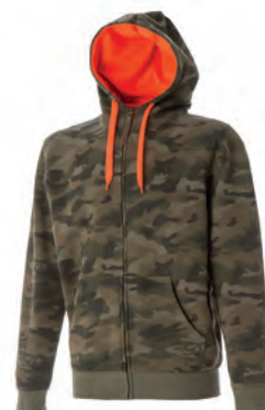
CAMOUFLAGE GREEN 989349 details ORANGE FLUO