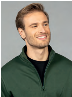
Collo a lupetto in costina elasticizzata