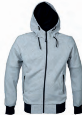
GREY MELANGE 993023