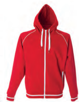
RED 988605 details WHITE