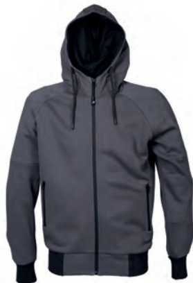
DARK GREY 993022