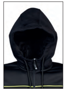
Cappuccio con fodera traforata