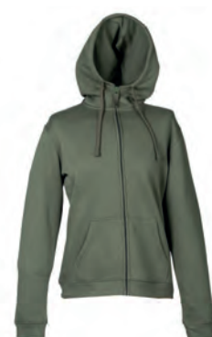
ARMY GREEN 993326