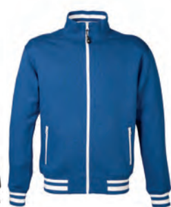
ROYAL 993996 details WHITE