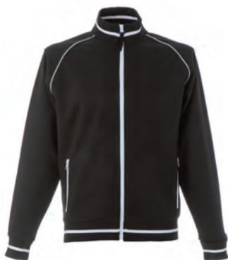
BLACK 989294 details WHITE