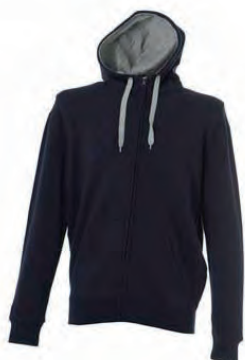
NAVY 989340 details MELANGE