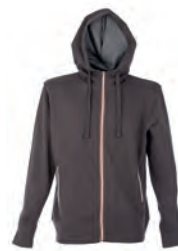
DARK GREY 992841