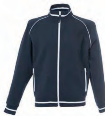
NAVY 989290 details WHITE