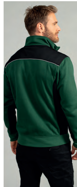
Piping rifrangente sulla parte alta della schiena