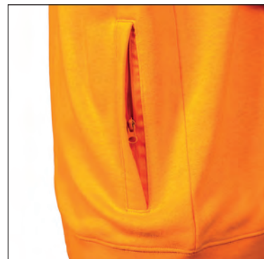
Due tasche con zip coperte