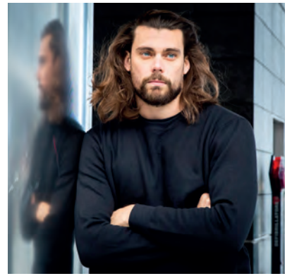
Cucitura incrociata sotto il collo