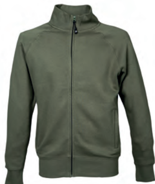
ARMY GREEN 993121