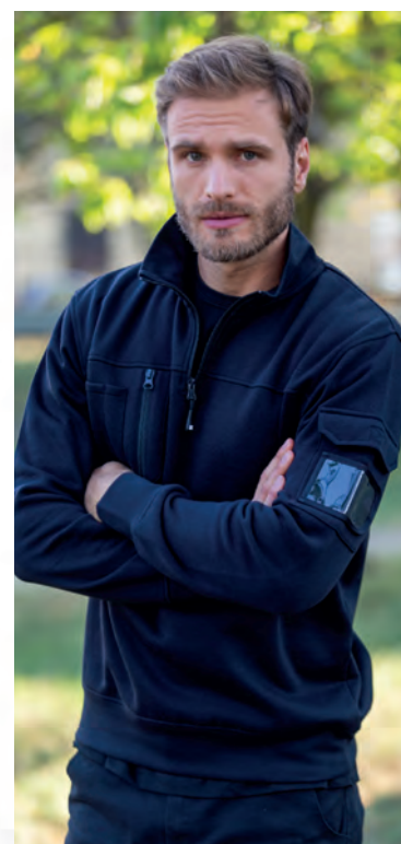
Tasca sul braccio con portabadge