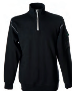
BLACK 987104 details MELANGE