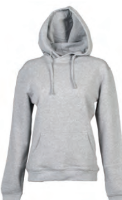
GREY MELANGE 994163