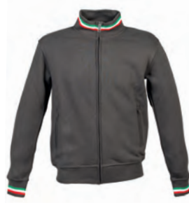
DARK GREY 993952