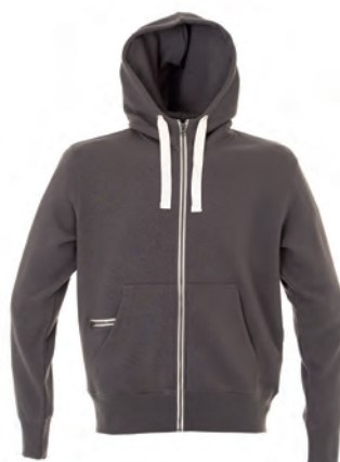
DARK GREY 991832