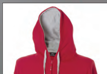
Cappuccio foderato in jersey con cordini in contrasto, colletto rialzato