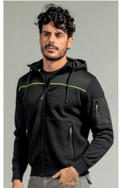
Piping giallo fluo anteriore e posteriore, una tasca con zip sul braccio, due tasche con zip