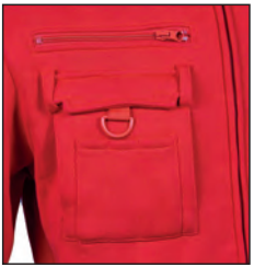
Tasche sul petto, triplo portapenne, gancio portachiave o badge