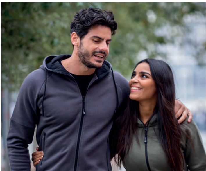
Maniche raglan, cerniere nastrate