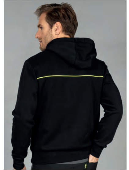
Cappuccio foderato in jersey giallo fluo