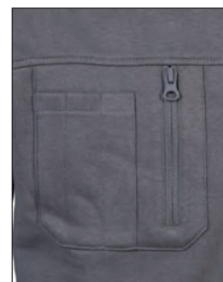
Tasca sul petto con zip e triplo portapenne