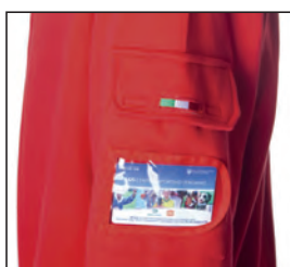
Tasca con portabadge sul braccio e bandierina tricolore