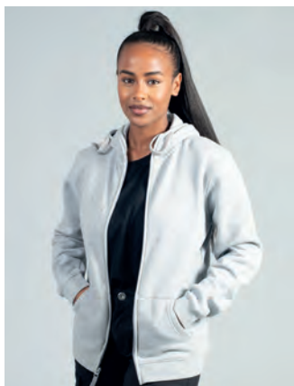
Tasche a marsupio