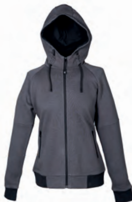
DARK GREY 993202