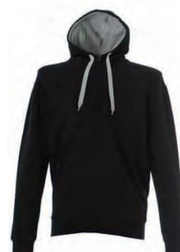
BLACK 989342 details MELANGE