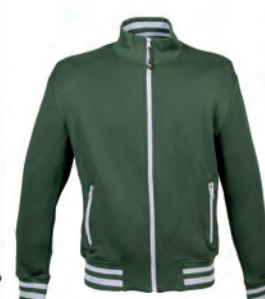
GREEN 993995 details GREY