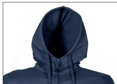
Cappuccio foderato in jersey, colletto rialzato