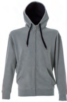
MELANGE 989341 details NAVY