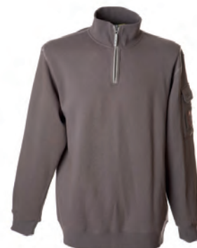
GREY 987101 details MELANGE