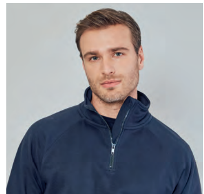
Maniche raglan, tessuto a protezione del mento