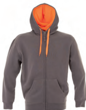
DARK GREY 989345 details ORANGE FLUO