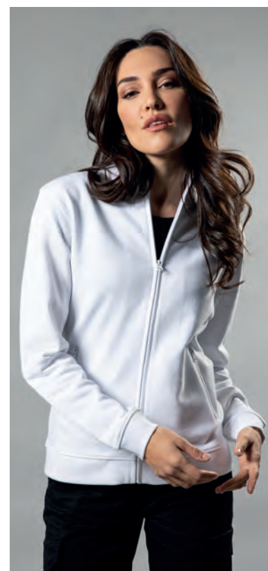
Polsini e fondo maglia in costina elasticizzata