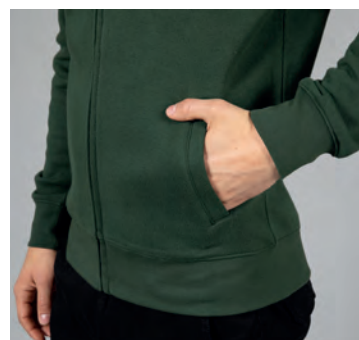
Due tasche aperte