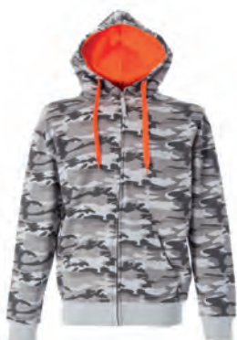
CAMOUFLAGE GREY 989347 details ORANGE FLUO