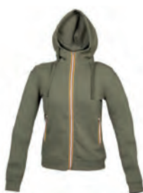
ARMY GREEN 992855