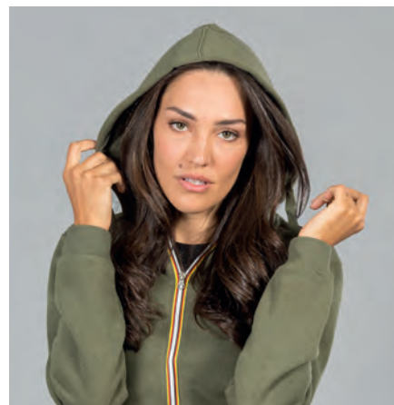
Cappuccio foderato in jersey