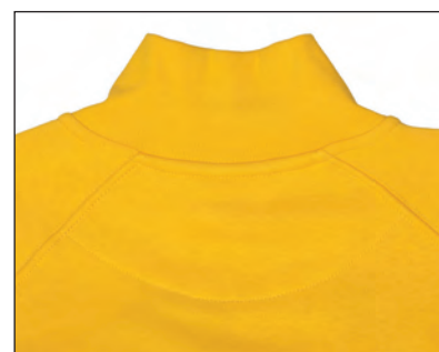
Mezzaluna di rinforzo dietro il collo