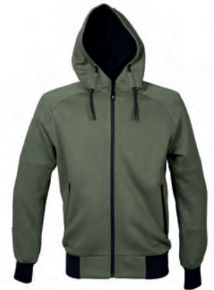
ARMY GREEN 993024