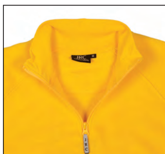
Collo a lupetto in costina elasticizzata