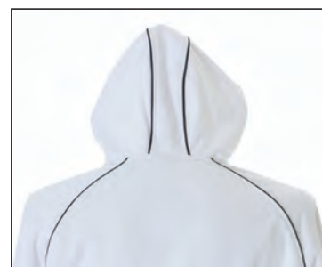
Profili in contrasto su cappuccio e spalle, maniche raglan