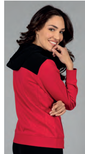
Spalle e cappuccio in contrasto