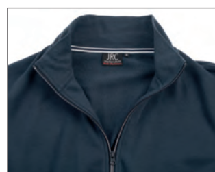
Nastro di rinforzo bicolore interno collo