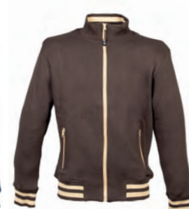
BROWN 993992 details BEIGE