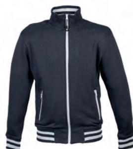
NAVY 993990 details GREY