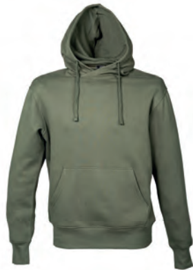
ARMY GREEN 993336