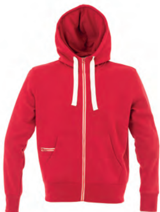
DARK RED 991833