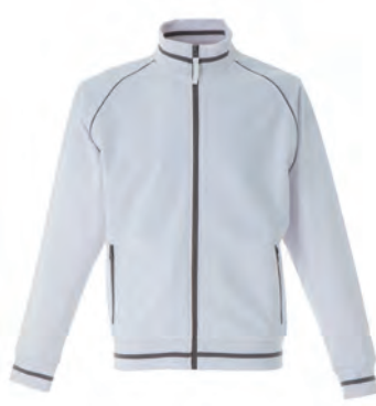
WHITE 989293 details GREY