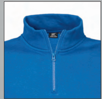
Collo a lupetto in felpa, zip corta