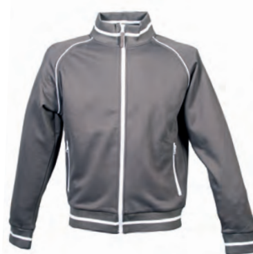
GREY 989291 details WHITE