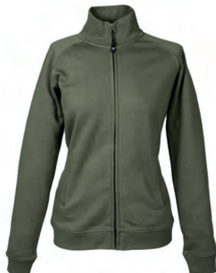
ARMY GREEN 993141