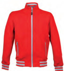
RED 993994 details GREY