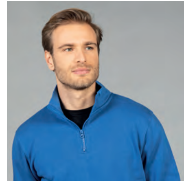
Collo a lupetto in felpa