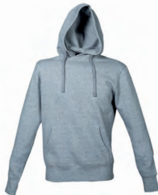
GREY MELANGE 993333