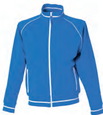
ROYAL 989292 details WHITE