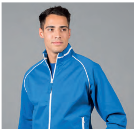
Cerniere nastrate, profili in contrasto su spalle