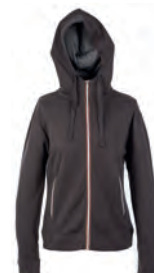
DARK GREY 992851