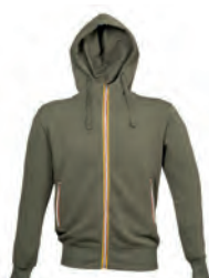
ARMY GREEN 992845