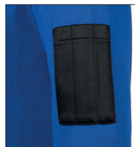
Triplo portapenne sul braccio