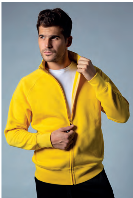
Zip lunga coperta