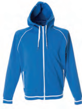
ROYAL 988604 details WHITE