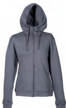
DARK GREY 993322